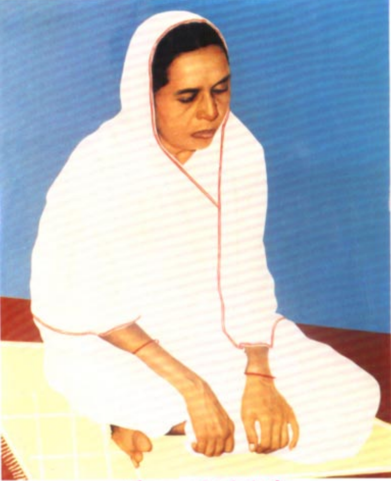
प्रशममूर्ति पूज्य गढेनश्री चंपाढेन

श्री दिगंबर जैन स्वाध्यायमंदिर ट्रस्ट, सोनगढ - 364250