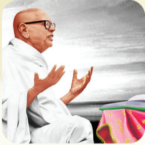
પૂ. સદ્ગુરુદેવશ્રી કાનજીસ્વામી