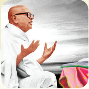
પૂ. સદ્ગુરુદેવશ્રી કાનજીસ્વામી