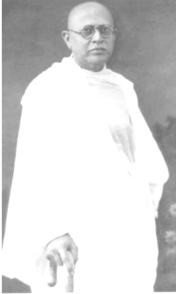
પરમ પૂજ્ય સદ્ગુરુદેવશ્રી કાનજીસ્વામી