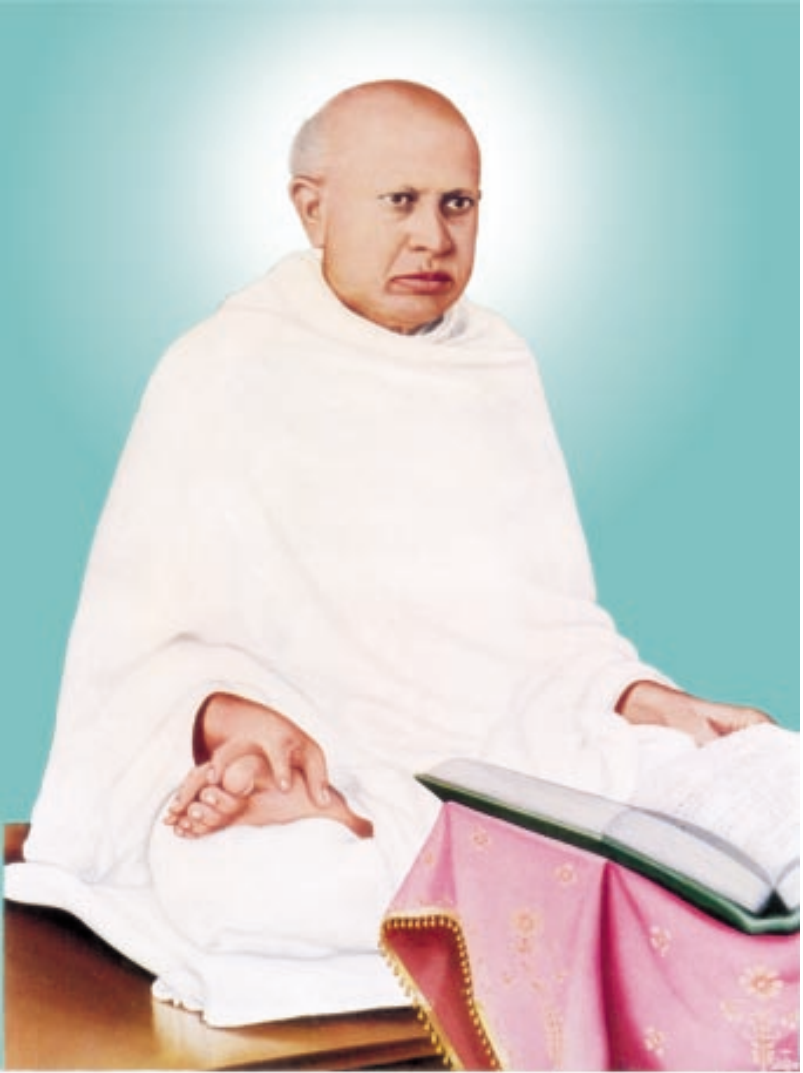
परम पूज्य अध्यात्मभूर्ति सद्गुरुदेव श्री कान्जुस्वामी